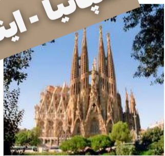
بارسلونا - زم - واتیکان سواحل آملفی و پوزیتانو فلورانس - ونیز