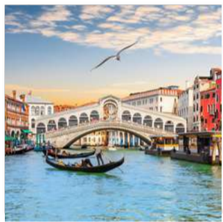
زم - واتیکان سواحل آملفی و پوزیتانو فلورانس - ونیز