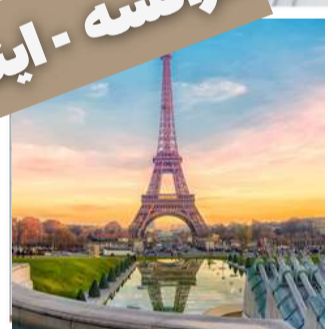
زم - واتیکان سواحل آملفی و پوزیتانو فلورانس - ونیز - پاریس