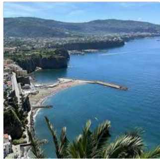
زم - واتیکان سواحل آملفی و پوزیتانو