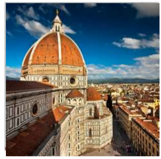
زم - واتیکان سواحل آملفی و پوزیتانو فلورانس